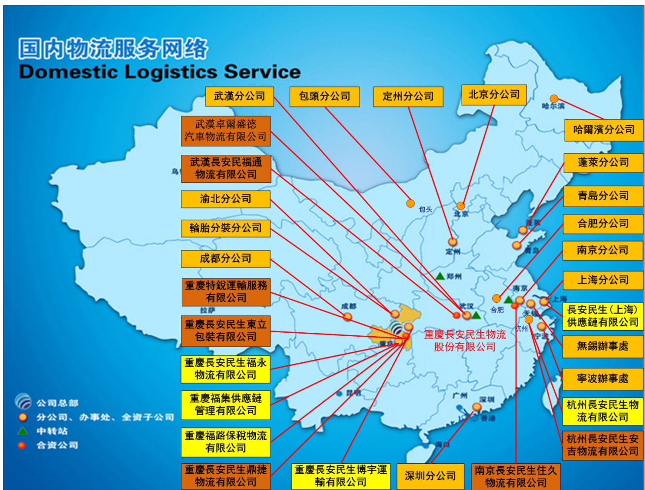
圖二：公司目前的分支機構分佈圖

截至2015年12月31日止，本公司累計設立分公司、子公司、聯營企業和辦事處29個，主要分佈在華東、華中、華北、華南和西南地區（圖二）。不斷完善的服務網路，令本集團能提供物流服務至全國各地。